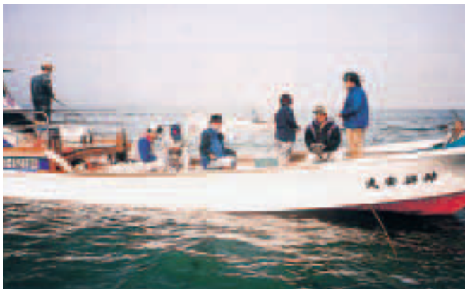
有明海での漁業体験