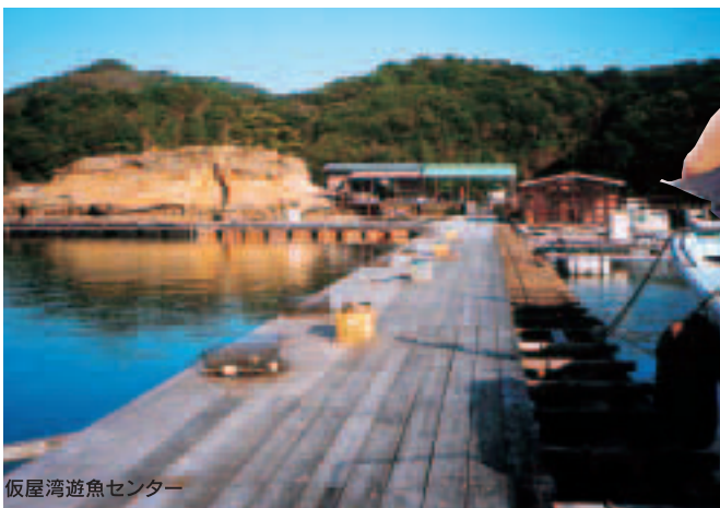
仮屋湾遊漁センター