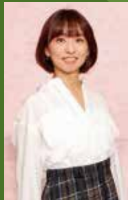
ゲスト 住吉美紀氏